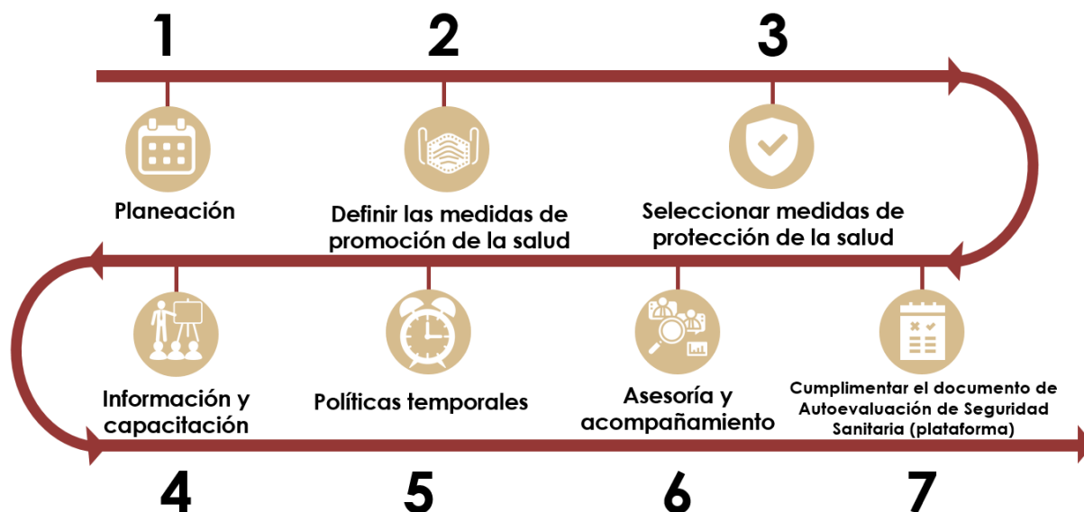
Diagrama 3. Pasos para establecer los Protocolo de Seguridad Sanitaria

Debe recordarse que, dependiendo de su ubicación, muchos centros de trabajo deberán continuar con la suspensión de actividades, tomando en cuenta las instrucciones de la autoridad sanitaria y las directrices incluidas en estos lineamientos.